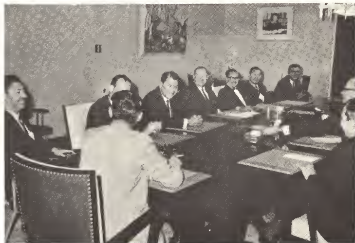
Bestuurscollege di Aruba yen di alegría a biaha pa Corsow pa entrega e peticion na Gobierno Hulandes mediante e Gobierno Antiyano pa financiamiento di e mehoracion di infraestructura di e Haaf di Barcadera pa establecimiento di un Dry-dock na Aruba, cual lo ta un bendicion pa henter e Pueblo Arubano.

Turismo cu durante ultimo anjanan a crece enorme y cu te ainda ta un industria cu ta progresa, no por haci nos ciego pa e realidad cu Aruba mester di entrada riba mas tanto tereno posibel pa situacion di nos isla bira un situa-